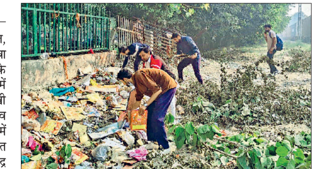
बहादुरगढ़। सार्वजनिक स्थान से धार्मिक सामग्री एकत्रित करते संस्थाओं के सदस्य।