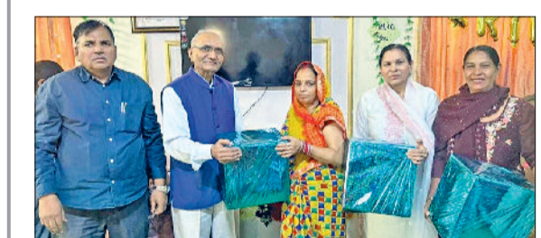
बहादुरगढ़। कृपाल आश्रम में सिलाई सेंटर ट्रेनर को सम्मानित करते आश्रम पदाधिकारी।