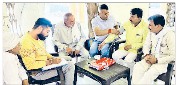
बहादुरगढ़। जाखड़ा गांव में लगे शिविर में लोगों का स्वास्थ्य जांचते चिकित्सक।