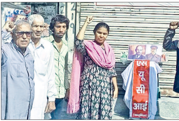
बहादुरगढ़। लेनिन व स्टालिन के चित्रों पर पुष्पांजलि अर्पित करते कमेटी सदस्य।

माक्सवादी चिंतक कामरेड शिवदास घोष की बताई शिक्षाओं के अनुसार महान नवंबर क्रांति की सीखों को याद किया गया। वक्ताओं ने बताया कि महान लेनिन के नेतृत्व में रूस के मजदूर-किसानों ने 7 नवंबर 1917 को पूंजीपतियों का राज उखाड़ कर दुनिया की पहली समाजवादी क्रांति सफल की थी। रूस की क्रांति ने हर तरह के शोषण