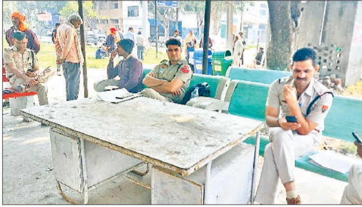
झंझर। नागरिक अस्पताल परिसर में पोस्टमार्टम के लिए कागजी कार्यवाई करते हुए पुलिसकर्मी।