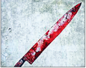
लेकर आए जहां, डॉक्टरों ने उसको मृत घोषित कर दिया।

गांव रोहद में गर्दन पर चाकू से प्रहार कर एक युवक की हत्या कर दी गई। मृतक के तीन दोस्तों पर ही वारदात को अंजाम देने का आरोप है। पुलिस ने पोस्टमार्टम करा शव परिजनों को सौंप दिया है। इस संबंध में तीन युवकों के खिलाफ आसौदा थाने में केस दर्ज हुआ है। पुलिस द्वारा जल्द ही आरोपियों को गिरफ्तार करने की बात कही गई है।