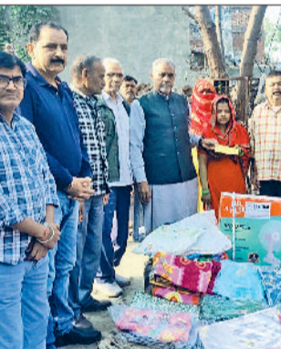
बहादुरगढ़। कन्या की शादी के लिए सामान लेकर पहुंचे समिति सदस्य।