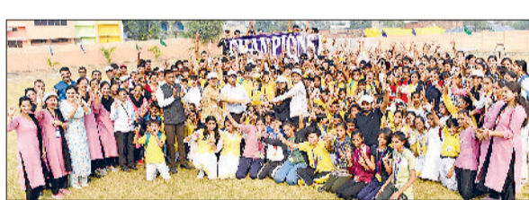
झज्जर। प्रतियोगिता के समापन पर विजयी चिन्ह बनाते हुए विजेता खिलाड़ी।