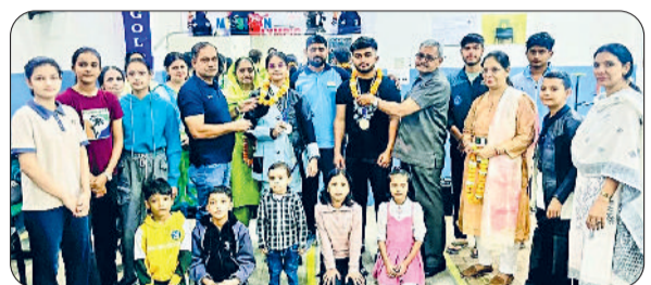
बहादुरगढ़। विजेता शूटर्स का स्वागत सम्मान करते अकेडमी संचालक व अन्य।