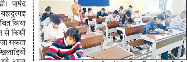
झज्जर। सुपर 30 फेज टू परीक्षा देते हुए विद्यार्थी।