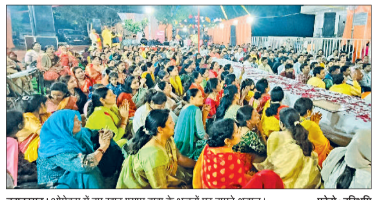
बहादुरगढ़। ओमेक्स में हुए खाटू श्याम बाबा के भजनों पर झूमते श्रद्धालु।

ऊर्जा, पशुपालन, मत्स्यपालन, बाल कल्याण कार्यालय, बाल संरक्षण कार्यालय, रेडक्रॉस, खाद्य आपूर्ति विभाग के राशन कार्ड संबंधी अधिकारी, बिजली विभाग, वन स्टॉप सेंटर, शिक्षा विभाग, बीएसएनएल, जन स्वस्थ एवं अभियांत्रिकी विभाग, राष्ट्रीय ग्रामीण आजीविका मिशन, सिंचाई विभाग बागवानी विभाग, बिजली निगम, बैंक, लेबर डिपार्टमेंट, रोजगार कार्यालय, हरियाणा रोडवेज विभाग, एमडीडी ऑफ इंडिया संस्था आदि के सदस्य आमजन को समस्याओं का मौके पर निदान करेंगे। उन्होंने बताया कि कैप का मुख्य उद्देश्य सभी विभागों की सुविधा एक छत के नीचे प्रदान करते हुए आमजन की समस्याओं का समाधान करना है।