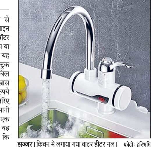
झंझर। किचन में लगाया गया वाटर हीटर नल।

सर्दी में पानी गर्म करने की किल्लत से छुटकारा दिलाने के लिए आजकल ऑनलाइन वस्तुएं बेचने वाली साइटों पर एक ऐसी वॉटर हीटर नल मिल रहा है जिन्हें सीधे बाथरूम या किचन के नल में फिट किया जा सकता है। यह इलेक्ट्रिक वाटर हीटर जहां गैस एवं इलेक्ट्रिक गीजर के मुकाबले सस्ता है वहीं बिजली बिल भी इनके मुकाबले बजट में रहता है। खास बात यह है कि करीब एक हजार दो सौ रुपये कीमत वाले इस छोटे से वाटर हीटर के जरिए ठंडा पानी भी बहुत तेजी से गर्म होता है। पानी का टैंपरेचर देखने के लिए इसी के अंदर एक डिजिटल डिस्पले दिया गया जिससे यह अंदाजा सहज ही लगाया जा सकता है कि पानी कितना गर्म है।